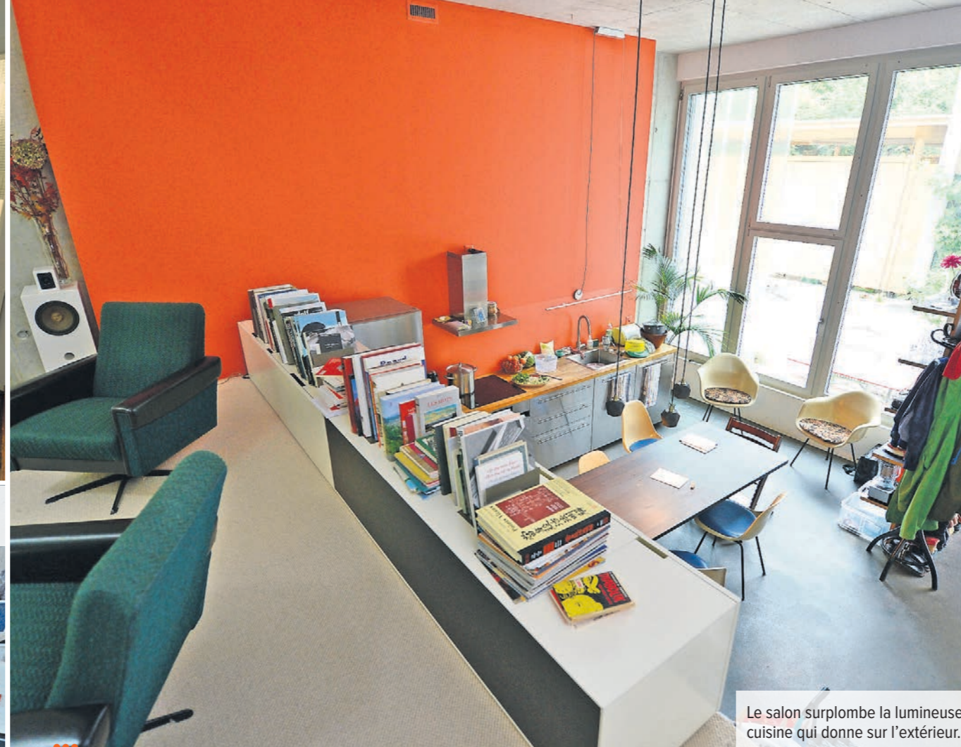
Le salon surplombe la lumineuse cuisine qui donne sur l'extérieur.

... geste pour le terrain car elle a été séduite par le projet de coopérative sans voiture.» De plus en plus de citadins font ce choix comme en témoigne l'évolution du taux de motorisation dans les principales villes suisses (voir infographie en page 16).