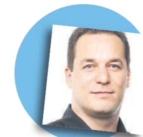
Emmanuel Rey Directeur du Laboratoire d'architecture et technologies durables (LAST) de l'EPFL

deste au plus spacieux. Chaque module peut se décliner dans une grande diversité de types et fonctions. Les modules peuvent être agglomérés en studios, appartements de 1,5 à 4,5 pièces ou vastes attiques.