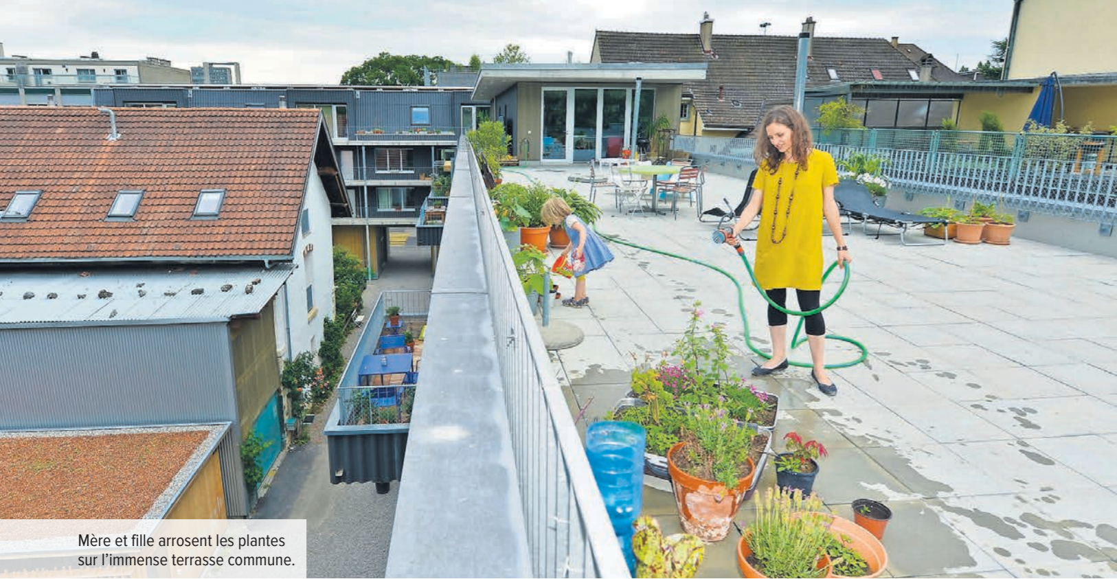
Mère et fille arrosent les plantes sur l'immense terrasse commune.