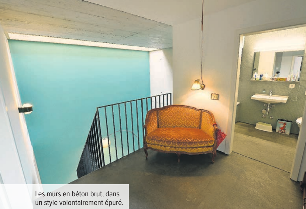
Les murs en béton brut, dans un style volontairement épuré.

Swisswoodhouse est basé sur un module de base de 22 m 2 , à partir duquel les acquéreurs peuvent modeler à volonté leur appartement, du plus mo-