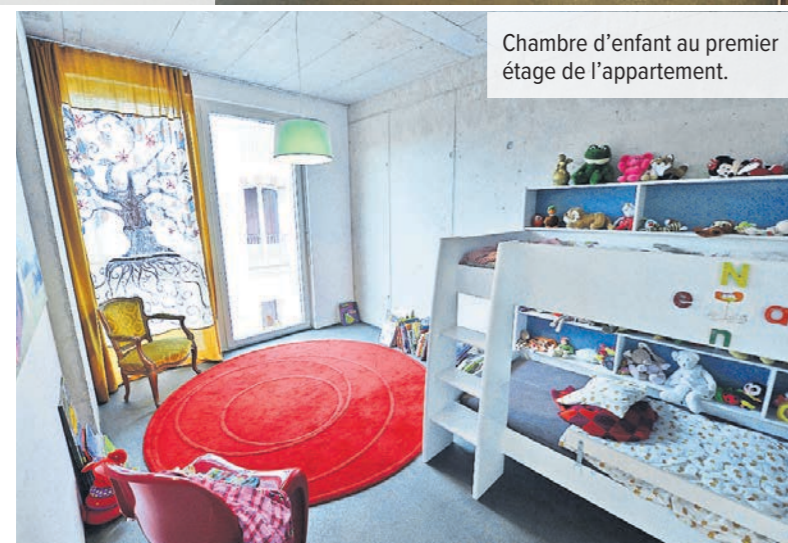
Chambre d'enfant au premier étage de l'appartement.