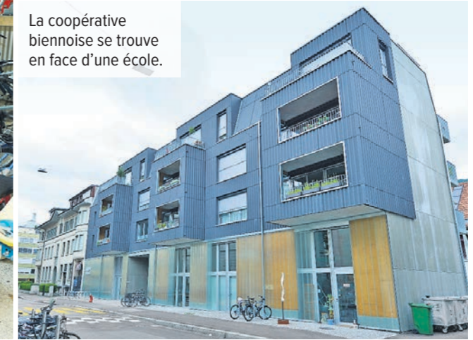
La coopérative biennoise se trouve en face d'une école.

... beaucoup à la vie collective. Je ne suis pas Biennoise mais on se sent vite à la maison! On est très bien intégrés ici. C'est génial avec tous ces enfants. Ils jouent beaucoup ensemble. Les grands font attention aux petits.»