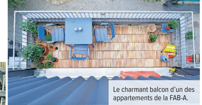
Le charmant balcon d'un des appartements de la FAB-A.